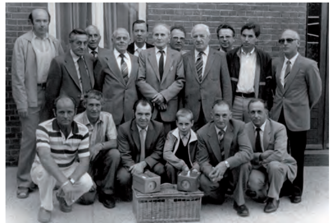
Foto gemaakt bij gelegenheid van het 75-jarig bestaan.

Hiervan zijn geen documenten beschikbaar. Aan dit jubileum is kennelijk geen aandacht besteed.