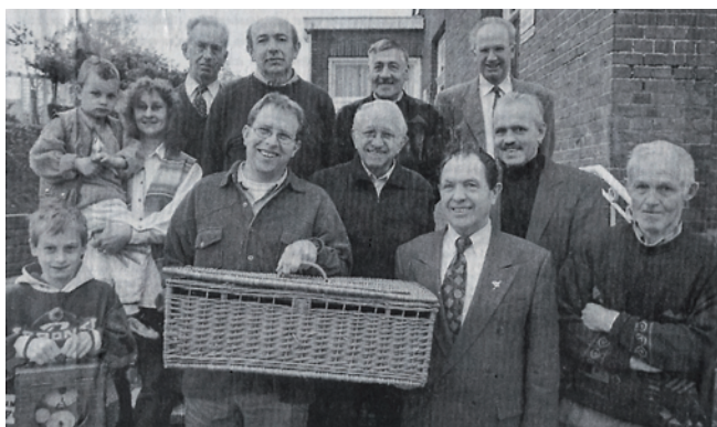
Foto gemaakt bij gelegenheid van het 90-jarig bestaan.

Het 90-jarig bestaansfeest was achteraf gezien het laatste jubileum. Het feest werd gevierd in Café Weerts.