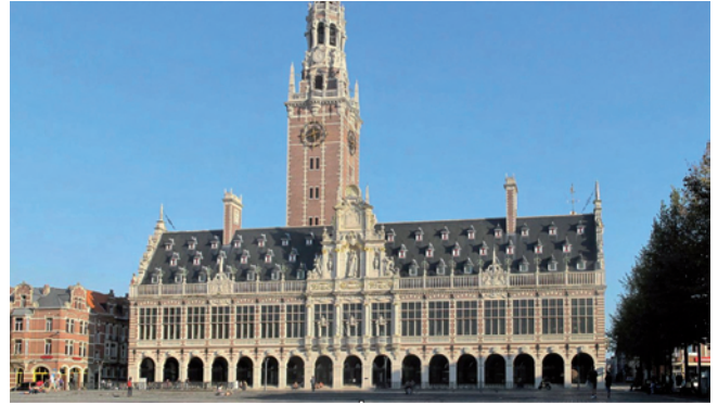
De imposante universiteitsbibliotheek

Het bezoek aan de Kruidtuin, de botanische tuin van de universiteit met zijn prachtige parkaanleg en tropische kassen, was één van de hoogtepunten van de dag. Vandaar ging het verder naar het zuidelijke deel van de binnenstad, naar het Groot Begijnhof. Dit begijnhof, met zijn sfeervolle bebouwing uit voornamelijk de zeventiende eeuw, is een aparte ommuurde wijk binnen de stad. De