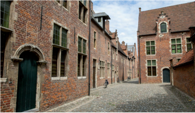
Het Groot Begijnhof

markt in zuidelijke richting en vervolgden we onze weg naar de Grote Markt. Na het nuttigen van een lunch ging de route richting het 'oude' academische ziekenhuis van Leuven, dat samen met de medische faculteit een complete wijk in de binnenstad in beslag neemt. Toch blijft de historie ook hier zichtbaar, bijvoorbeeld in een restant van de oude, eerste stadsmuur.