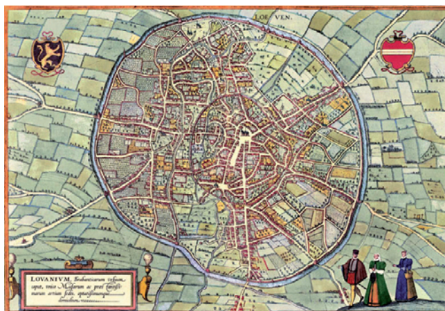
Leuven in 1592

Ook de universiteit werd toen, in 1425, opgericht. Hoewel Leuven de oudste universiteitsstad van Europa is, is de universiteit dat zelf niet. Herhaaldelijk is ze door slechte economische omstandigheden, maar vooral door politieke beslissingen, opgeheven. Meestal werd na een korte periode weer een nieuwe universiteit opgericht. De huidige Katholieke Universiteit Leuven stamt uit 1835.