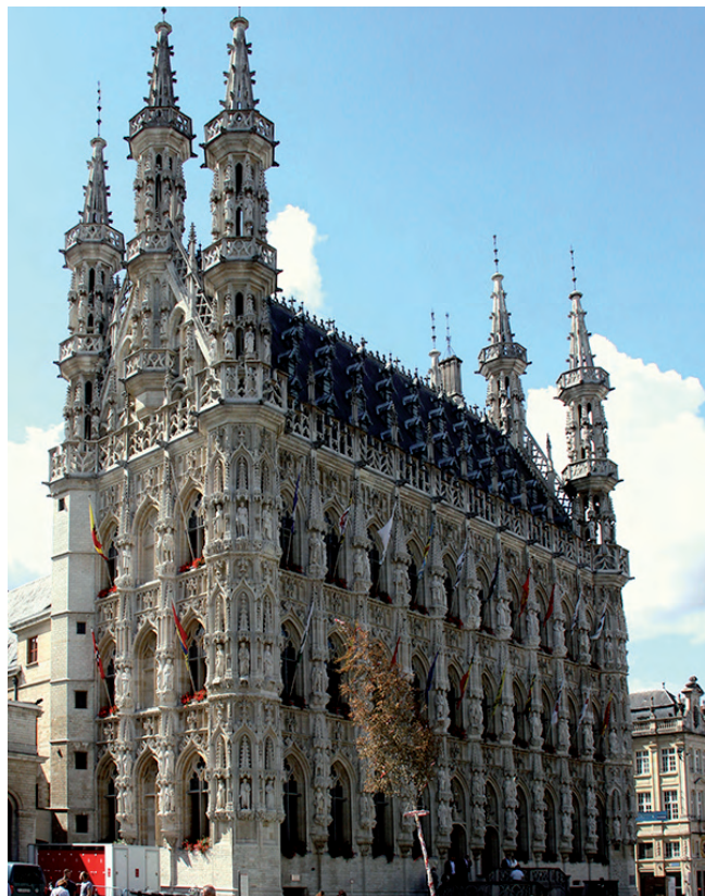
Het indrukwekkende stadhuis op de Grote Markt

geheel uit, waardoor opnieuw alle boeken verloren gingen.