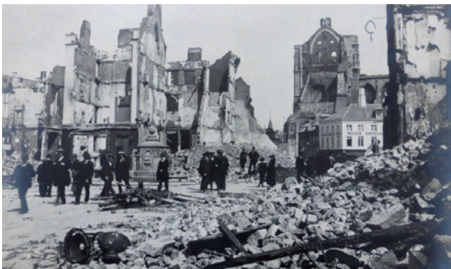
Het in 1914 verwoeste centrum van Leuven

roemde middeleeuwse stadhuis bleef gespaard. In de propagandaoorlog van de Eerste Wereldoorlog speelde de verwoesting van Leuven een belangrijke rol. Wereldwijd werden er acties opgezet voor financiële ondersteuning van de wederopbouw, vooral voor de eveneens verwoeste universiteitsbibliotheek.