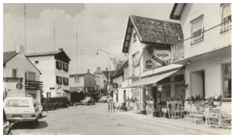
pensions Savelsberg en Silenzio van klein naar groot