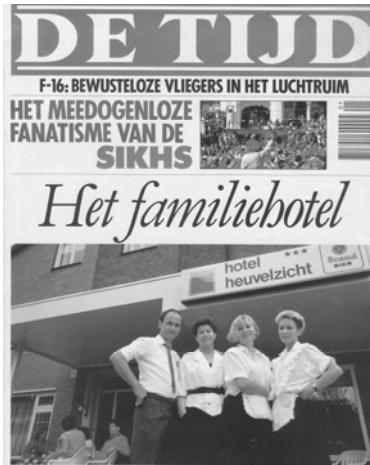
De Tijd, 24 juli 1987

“Toen d'r pap begon was het een gewoon vrijstaand woonhuis. Daar is eerst simpelweg een tweede verdieping op gezet. Dat was niet om aan te zien in feite, smal, langwerpig en hoog. Vervolgens is eerst aan de linkerkant een stuk ertegenaan gezet en naderhand hebben we ook aan de rechterkant uitgebreid. Als je ziet hoe lelijk dat aanvankelijk was ! Ook is aan de achterkant uitgebouwd, een overdekt terras werd eetzaal , enzovoort.”