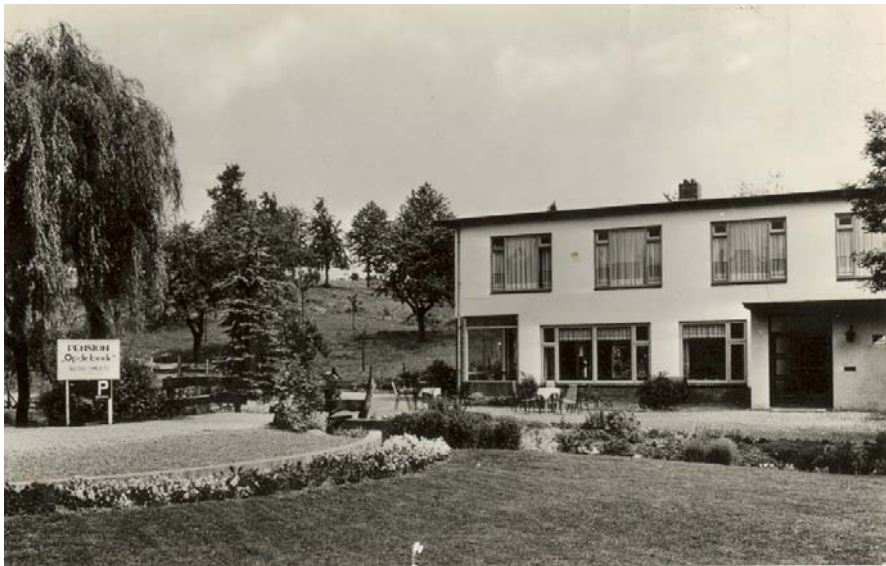
hotel ' Op de Beek'