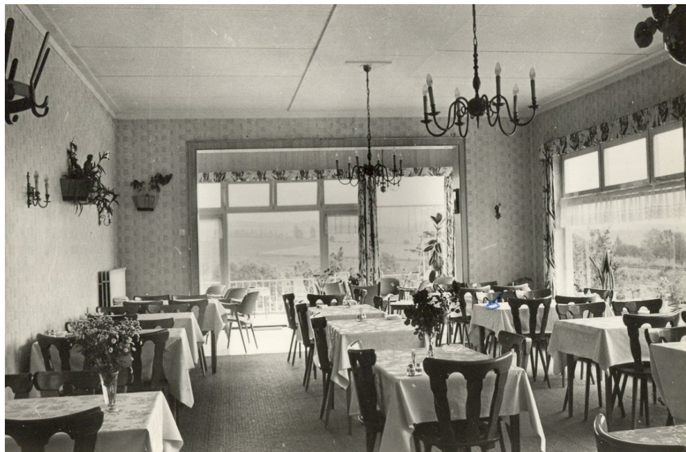
interieur ca. 1965

Ook typisch waren de beperkingen in de huisvesting. Ouders en kinderen maakten ruimte voor de gasten en namen tijdelijk genoeg met weinig slaap- en woonruimte. Daarbij moeten we wel bedenken dat in het begin het vakantieseizoen kort was: met zes weken was alles voorbij. Later kwam verruiming: een paar dagen met Pasen en Pinksteren, dan de vakantietijd; nog later het fenomeen herfstvakantie en in de loop der tachtiger jaren openstelling van Pasen tot en met Kerst en Nieuwjaar.