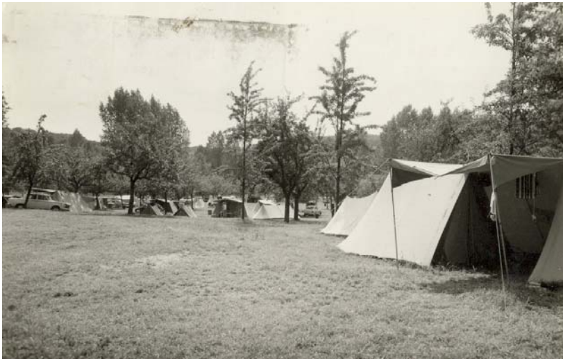
camping begin jaren zestig