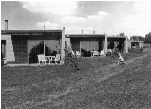
vakantiecentrum Schin op Geul ca 1980