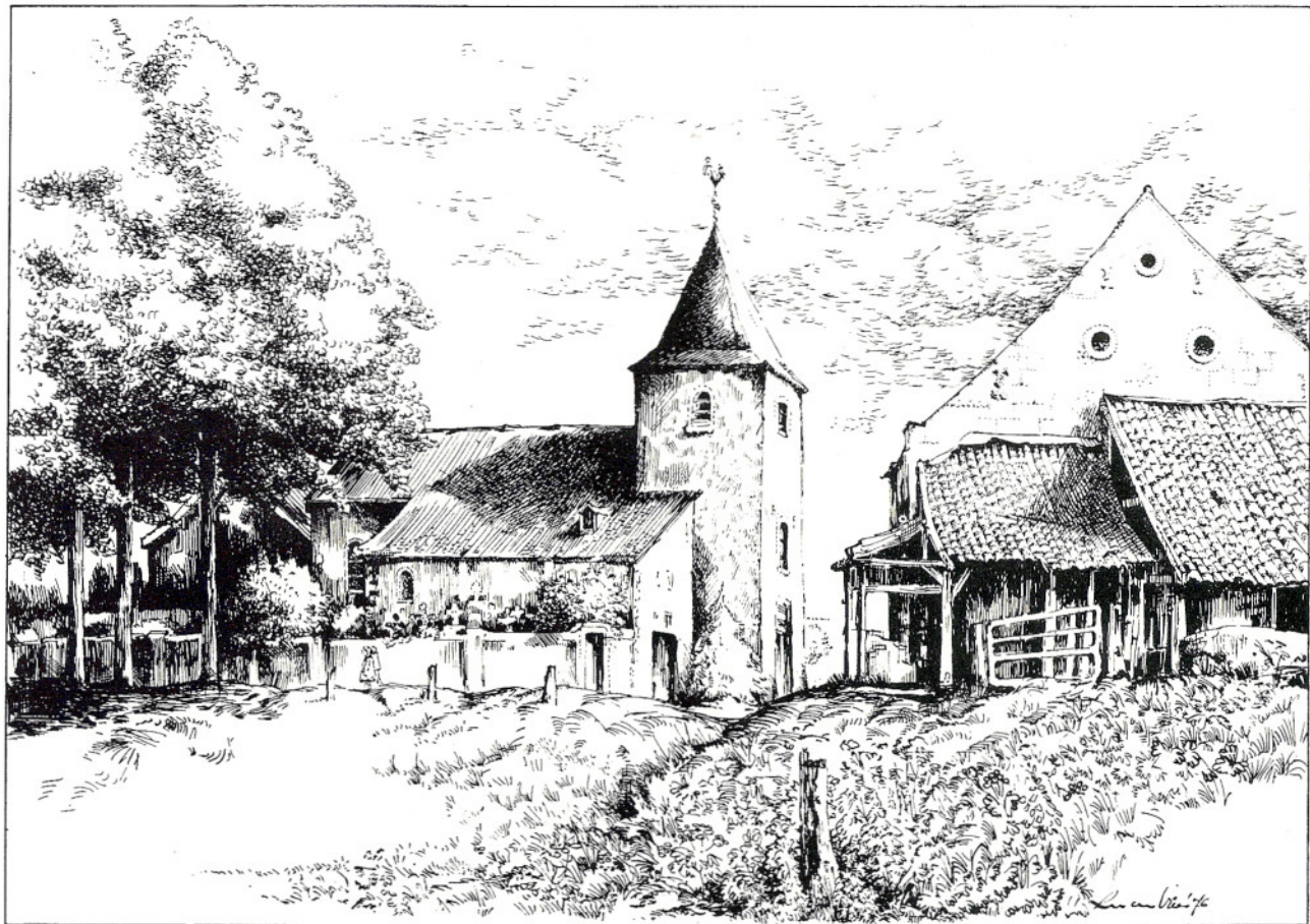
st. joannes de doperkerk in oud-valkenburg