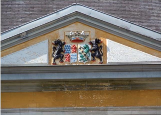
Alliantiewapen De Villers de Pit -de Pitteurs boven de ingang