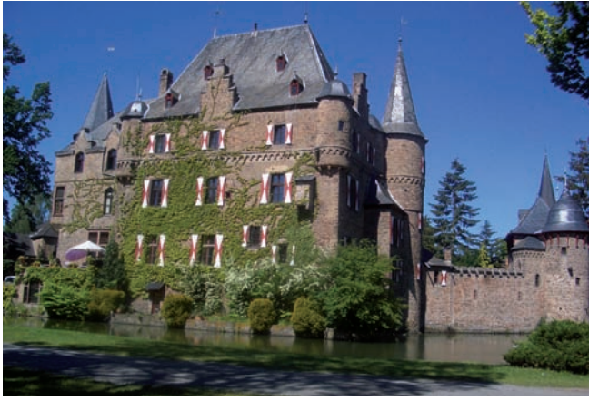
De imposante waterburcht Satzvey