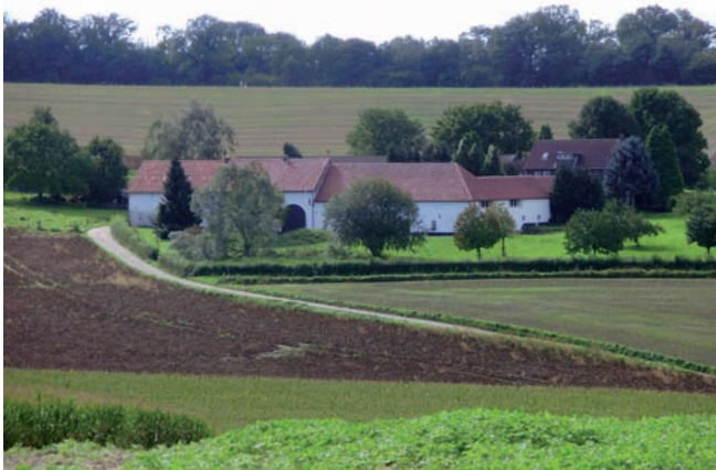
Hoeve Overhem (Euverem)

Adriaen richt zijn aandacht wat Oost betreft vooral op de juridische status ervan. Behoort het namelijk tot Valkenburg of toch tot de heerlijkheid en parochie Schin op Geul? Dit leidt zodoende tot een geschil als Adriaen zich, na het aflopen van de overeenkomst in 1644, niet langer heer van Schin op Geul mag noemen. Het blijkt uiteindelijk een jarenlange juridische strijd te worden die pas na twaalf jaar procederen, middels een compromis, beslecht wordt. Overigens werd reeds in 1663 het enkele jaren daarvoor bij de Spaanse koning ingediende verzoekschrift gehonoreerd, waarmee de verheffing van het huis Oost tot leengoed een feit is geworden. Het in 1664 gesloten compromis met de nieuwe heer van Schin op Geul – Johan Hoen van Cartils – omvat de bepalingen dat huis Oost vrijgesteld wordt van personele belastingen, maar dat de inwoners van Schin op Geul ter compensatie belasting mogen heffen op de ten oosten van Oost gelegen hoeve Overhem (“Euverem”), eveneens in eigendom van Adriaen de Grootte. De eigenaar van Oost zal de lage en middelbare justitie bezitten, doch alleen op huis Oost met inbegrip van vijvers en grachten, en niet daarbuiten. Tenslotte koopt