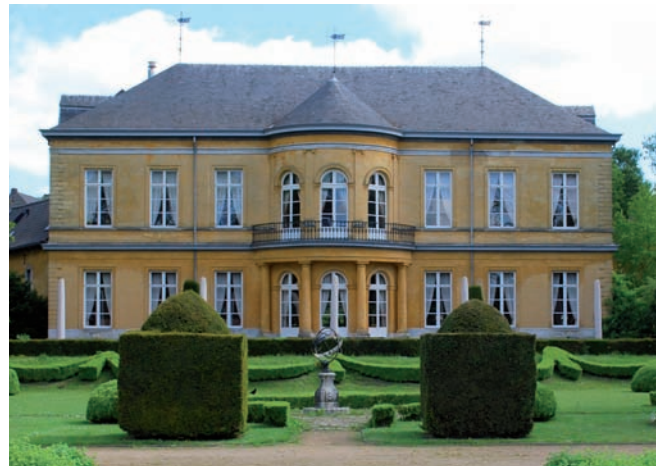
Kasteel Oost, vanaf de parkzijde

Adriaen nog het jachtrecht van een gebied rondom Oost en het visrecht op de Geul, vanaf de St. Jansbron in de richting van Valkenburg. Hiermee is de opwaardering van Oost als allodiaal leengoed tot mini-heerlijkheid, met eigen justitiële bevoegdheden, jacht- en visrecht en vrijheid van lokale belastingen, voltooid en krijgt het zodoende een passende status voor de heer van Strucht. Vanaf 1663 wordt er overigens veel ge- en verbouwd aan Oost. Na afronding van alle bouwwerkzaamheden in 1673 wordt Oost voor het eerst aangeduid als kasteel, zij het overigens door de eigenaren zelf.