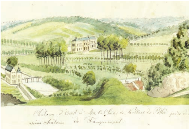
Kasteel Oost [Tekening: Philippe van Gulpen]