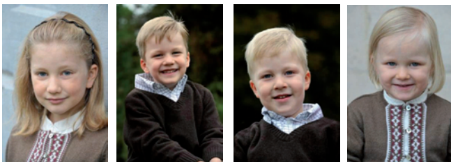
De kinderen van Filip en Mathilde (v.l.n.r.): prinses Elisabeth, prins Gabriël, prins Emmanuel en prinses Eléonore

Momenteel richt Mathilde zich op de rechten voor kinderen en kwetsbaren, naast de ondersteuning die zij haar man biedt tijdens handelsmissies in het buitenland. Ook heeft ze zich ingezet voor Microkrediet en ontwikkelings-samenwerking, en ondersteunt ze Unicef in hun campagnes tegen HIV en Aids.