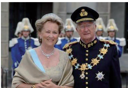
Koning Albert II en koningin Paola van België, geboren Ruffo di Calabria

Jonkvrouw Mathilde Marie Christine Ghislaine d'Udekem d'Acoz is op 20 januari 1973 te Ukkel geboren als oudste dochter van Patrick graaf d'Udekem d'Acoz en gravin Anne Marie Komorowska. Zij groeide op in het dorpje Villers-la-Bonne-Eau in de buurt van Bastogne en studeerde moderne talen en logopedie, beide in Brussel, waar zij naderhand een eigen logopedistenpraktijk voerde en ook deeltijds werkzaam was op een lagere school. In 1998 behaalde ze in Louvain-la-Neuve haar licentiaat in de psychologie.