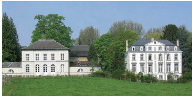
Kasteel Opleeuw, residentie van de baronnen de Mettecoven

Land van Luik, en maakte deel uit van het hoger hof van Vliermaal. De heerlijkheid Gors vormde samen met de hogergelegen heerlijkheid Opleeuw de latere gemeente Gors-Opleeuw. Gors heette in de veertiende eeuw Goederts-Lewe of Govert-Lewe, waarbij Lewe staat voor heuvel ; Opleeuw betekent dus letterlijk "Op de heuvel".