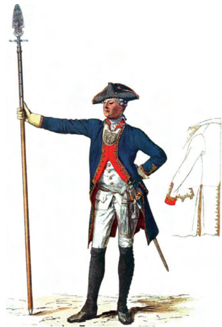
Uniform van het Pruisische infanterieregiment No. 27 "Von Kleist"