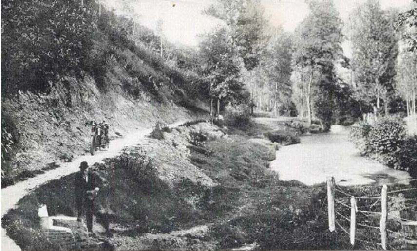
Schin op Geul bij Valkenburg Keutenberg met bron

Het dorp kende nog geen waterleiding. Water betrok men van een pomp of put. Er waren ook enkele bronnen, waarvan we de namen nog kennen: de Gronselleput aan de voet van de Keutenberg, de Heutspuit in “der Graaf” en de Sint Jansput in of bij de Geul bij kasteel Oost.