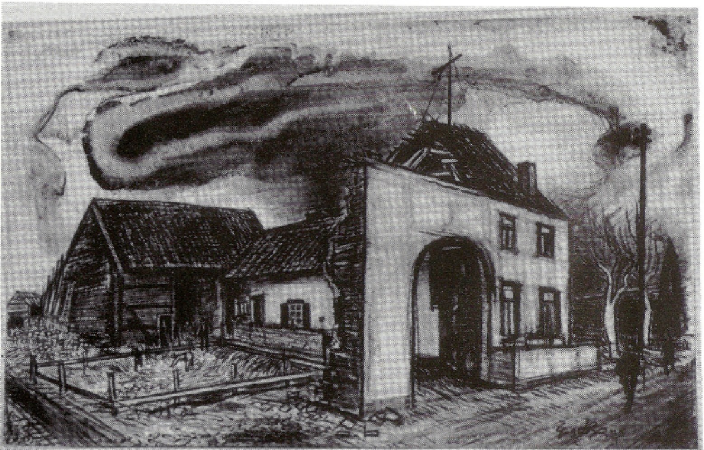
afbraak van hoeve Wallem, getekend in 1975 door Charles Eyck